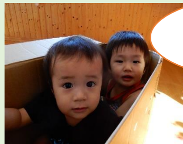
入ったよ♡ お友だちとも一緒！