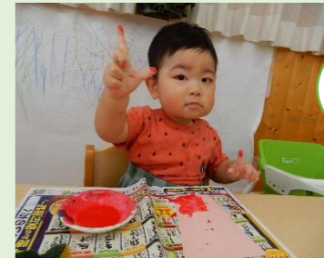
ちゅんちゅん... ついちゃった！